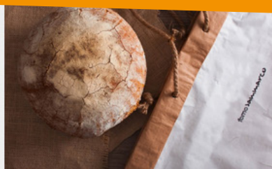
PANE INTEGRALE Forno Sammarco