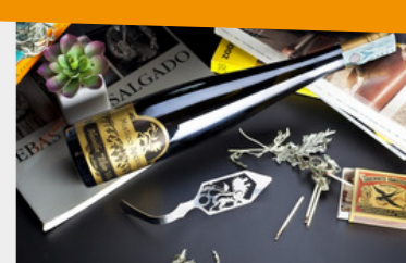
ABSINTHE "ELIXIR VITAE" BLANC Mistico Speciale