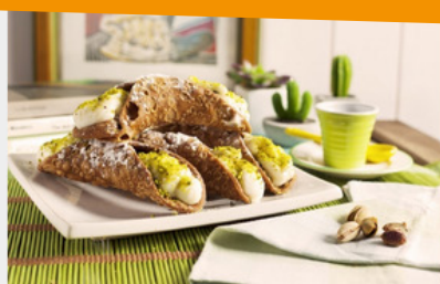
CANNOLI SICILIANI Pasticceria Campidoglio