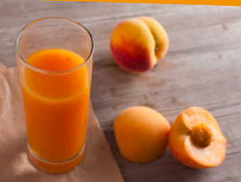
SUCCO DI PESCA Giòsole