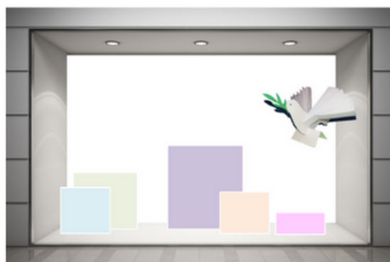
Basi di appoggio, come fondi colore, e sagoma colomba