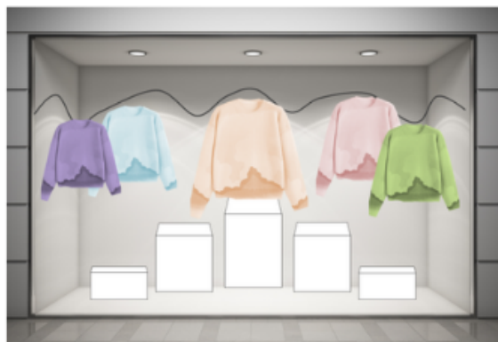
Vetrine con prodotto appeso e piegato su basi, vetrofania