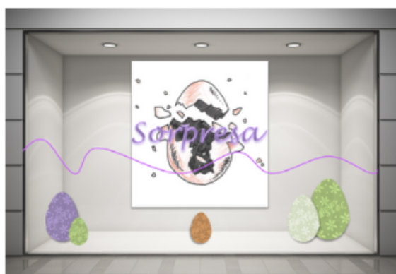
Vetrina con poster , sagome a forma di uovo e vetrofania

Si potrà così valutare un'immagine rassicurante , di tipo tradizionale, oppure un'immagine più aggiornata e innovativa, considerando l' ubicazione del Punto Vendita, il target della clientela, il design degli arredi e l' assortimento selezionato per l'allestimento delle vetrine.