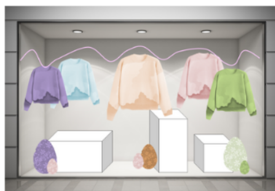
Vetrina con basi, sagome a forma di uovo e vetrofanie