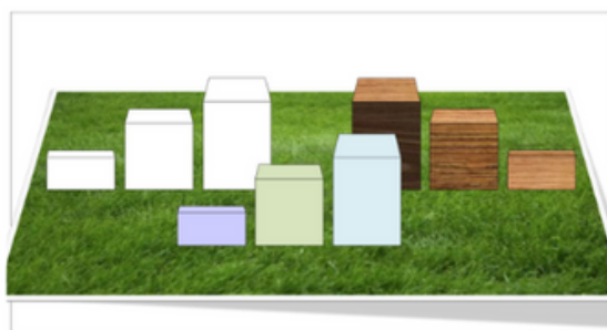
Base texture manto erboso