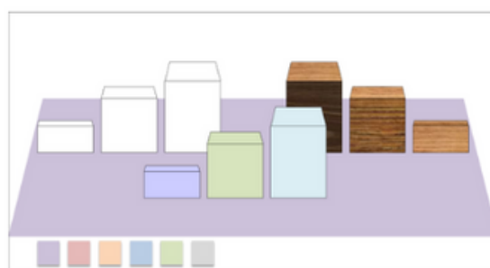
Base con tavolozza colori de-saturati