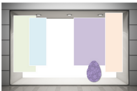
Pannelli quinta sospesi, come fondi colore, e sagoma uovo

4) A questo punto sarà fondamentale prevedere quinte o fondi colore da integrare alla scenografia, in modo da suggerire una maggior profondità alla vetrina.