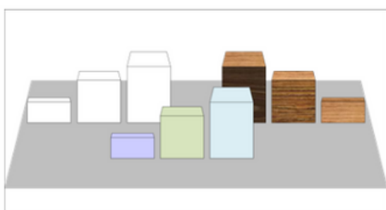
Base vetrina neutra

6) Non si dovrà trascurare la base della vetrina che potrà diventare pavimentazione in grado di presidiare e circoscrivere lo spazio, rafforzando l'insieme (Es. base fondo colore piatto oppure texture prato erboso/fiorito).