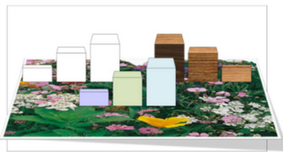
Base texture prato fiorito

7) Le vetrofanie potranno essere di aiuto alla scenografia, riprendendo la grafica e le tonalità utilizzate; in questo modo potranno facilitare la comprensione del messaggio (una Pasqua sorprendente!) fornendo ulteriori chiavi di lettura al racconto .